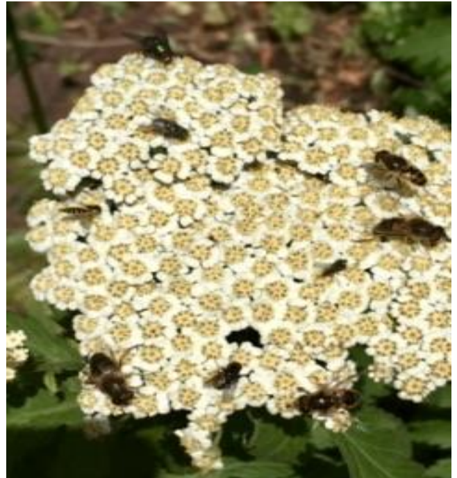
Een drukte van belang op een Achillea (Duizenblad)

Kopij voor de nieuwsbrief van juli kunt u aanleveren tot 15 juli.