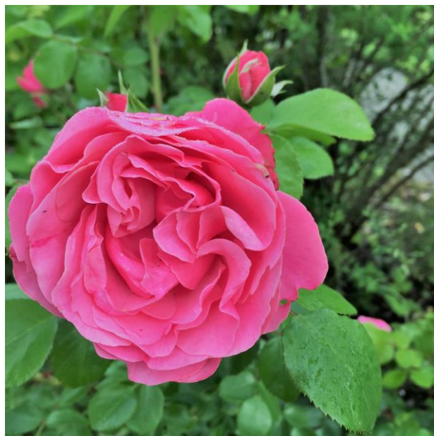
Roos Vincent van Gogh

Een nieuwe rubriek. We hebben allemaal wel eens iets over op de tuin maar je vindt het toch wel zonde om het weg te gooien. Bijvoorbeeld een plant, stekken, potten of gereedschap enz. Een ander op het complex is er misschien naar op zoek! Daar is deze rubriek voor. Het gaat om groen, en spullen die op de tuin bruikbaar zijn. Ben je naar iets op zoek of wil je iets kwijt, stuur dan een berichtje met een eventueel een foto naar: nutengenoegennieuws@outlook.com Het wordt dan in de eerstvolgende nieuwsbrief geplaatst.