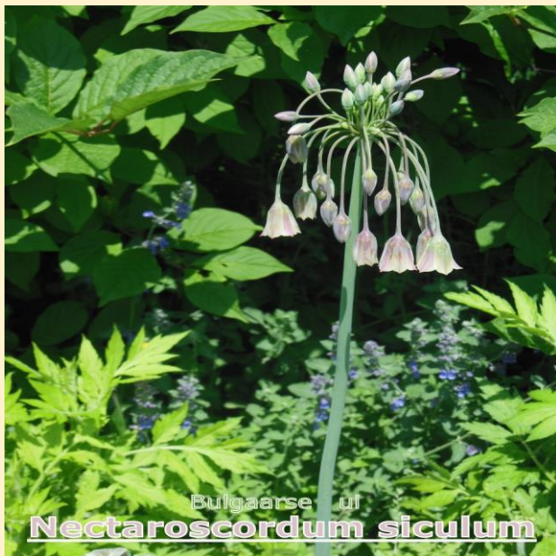
Bulgaarse ui Nectaroscordum siculum

Aankomende herfst wil ik meer van deze bollen planten.....ik vind ze prachtig (ze combineren zo goed).